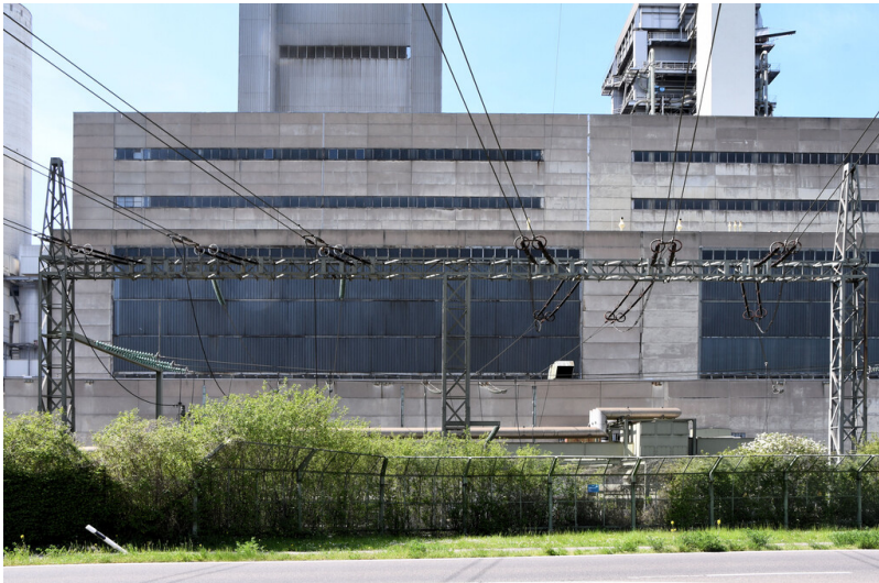
Kraftwerk Frimmersdorf II: Freileitungsabgangsfelder Block P (links) und Block Q (rechts), Ansicht von Osten