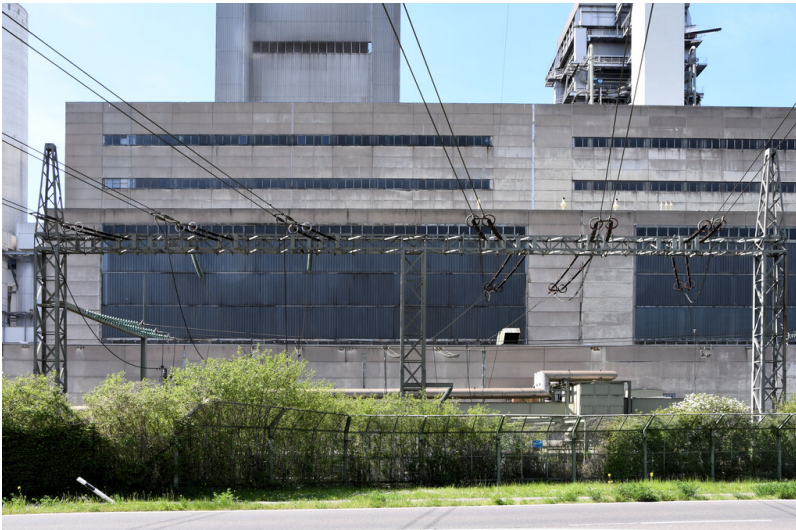
Kraftwerk Frimmersdorf II: Freileitungsabgangsfelder Block P (links) und Block Q (rechts), Ansicht von Osten