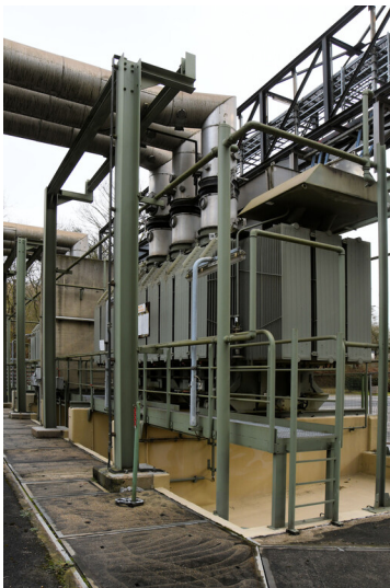
Kraftwerk Frimmersdorf II: Eigenbedarfstransformator Block P, Ansicht von Westen