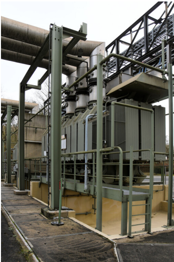
Kraftwerk Frimmersdorf II: Eigenbedarfstransformator Block P, Ansicht von Westen