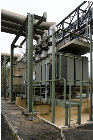
Kraftwerk Frimmersdorf II: Eigenbedarfstransformator Block P, Ansicht von Westen; Foto: 21.03.2023