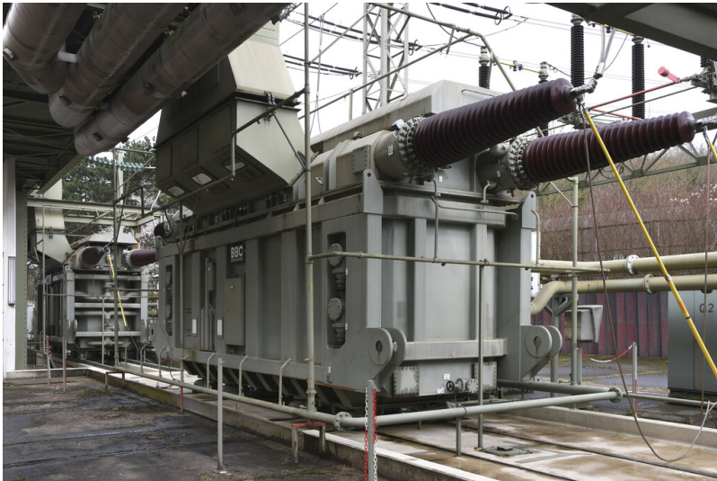
Kraftwerk Frimmersdorf II: Maschinentransformatoren Block Q, Ansicht von Südwesten