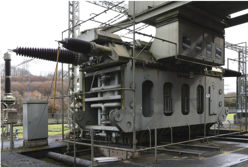
Kraftwerk Frimmersdorf II: Maschinentransformator Block N, Ansicht von Nordwesten; Foto: 22.03.2023