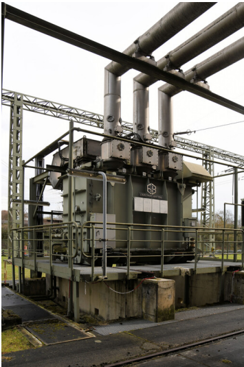
Kraftwerk Frimmersdorf II: Eigenbedarfstransformator der Anfahr-Anlage 1, Ansicht von Norden; Foto: 21.03.2023