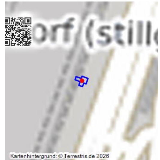
Kraftwerk Frimmersdorf II: Maschinentransformator Block G, zugehörige Leistungsschalter (2 Stück) und Erder, Ansicht von Norden