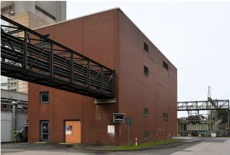
Kraftwerk Frimmersdorf II: Gebäude der 6-kV-Allgemein- und Anfahranlage für die Blöcke P und Q, Ansicht von Süden; Foto: 21.03.2023