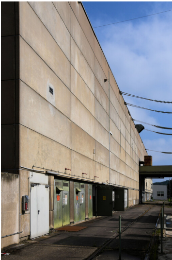
Kraftwerk Frimmersdorf II: Schaltanlagenvorbau Block P, Ansicht von Südosten; Foto: 23.06.2023