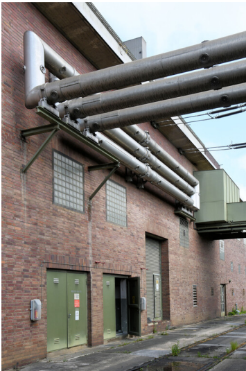
Kraftwerk Frimmersdorf II: Schaltanlagenvorbau Block N, Ansicht von Südosten; Foto: 23.06.2023