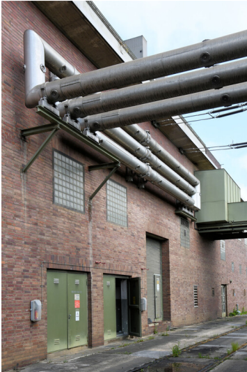
Kraftwerk Frimmersdorf II: Schaltanlagenvorbau Block N, Ansicht von Südosten; Foto: 23.06.2023