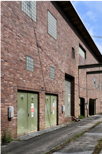
Kraftwerk Frimmersdorf II: Schaltanlagenvorbau Block K, Ansicht von Südosten; Foto: 23.06.2023