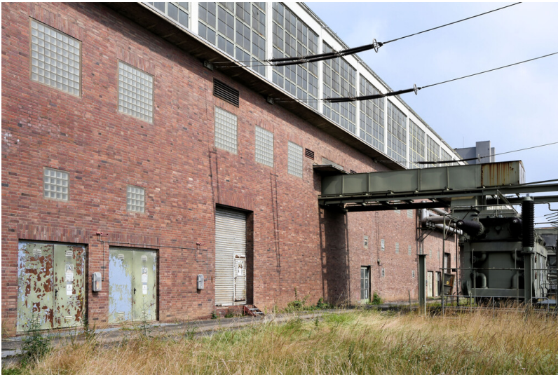
Kraftwerk Frimmersdorf II: Schaltanlagenvorbau Block E, Ansicht von Südosten; Foto: 23.06.2023