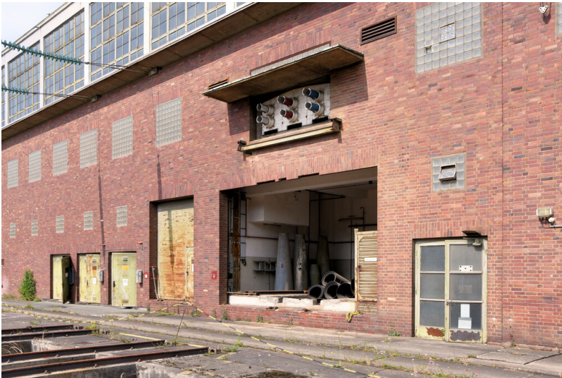
Kraftwerk Frimmersdorf II: Schaltanlagenvorbau Block C, Ansicht von Nordosten; Foto: 23.06.2023