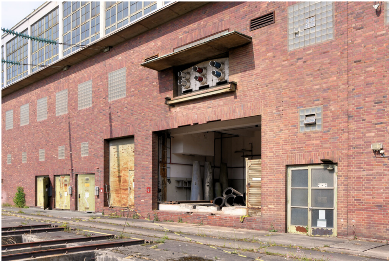
Kraftwerk Frimmersdorf II: Schaltanlagenvorbau Block C, Ansicht von Nordosten; Foto: 23.06.2023