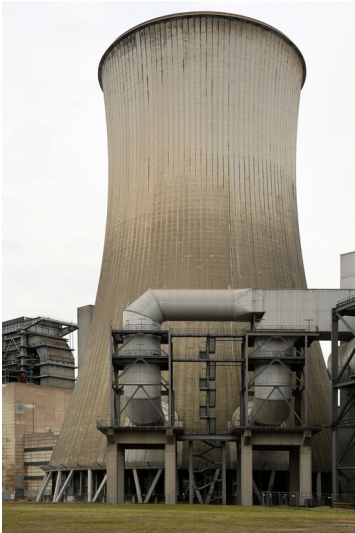
Kraftwerk Frimmersdorf II: Naturzug-Kühlturm von Block Q, Ansicht von Nordwesten; Foto: 22.03.2023