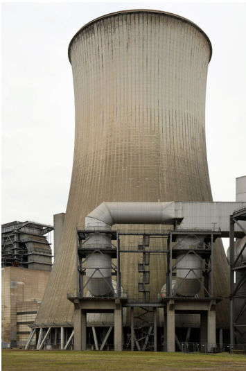
Kraftwerk Frimmersdorf II: Naturzug-Kühlturm von Block Q, Ansicht von Nordwesten