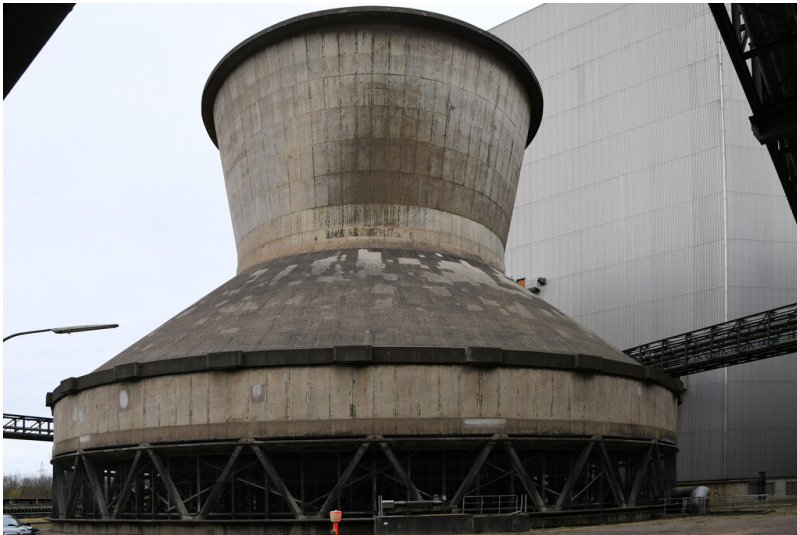
Kraftwerk Frimmersdorf II: Ventilator-Kühlturm P3, Ansicht von Nordwesten; Foto: 22.03.2023