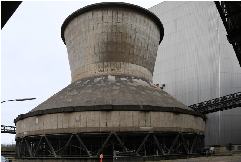
Kraftwerk Frimmersdorf II: Ventilator-Kühlturm P3, Ansicht von Nordwesten