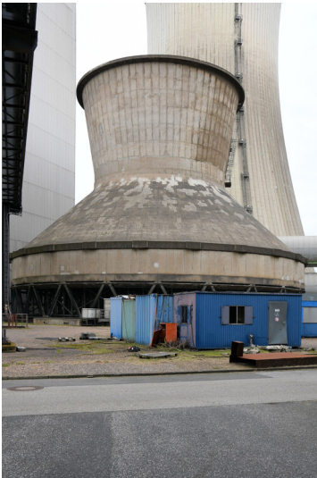
Kraftwerk Frimmersdorf II: Ventilator-Kühlturm P2, Ansicht von Süden; Foto: 22.03.2023