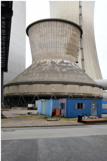
Kraftwerk Frimmersdorf II: Ventilator-Kühlturm P2, Ansicht von Süden