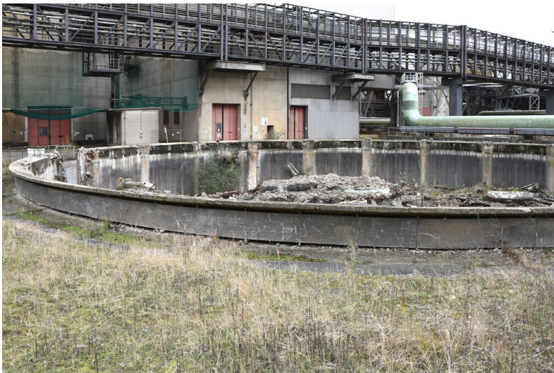
Kraftwerk Frimmersdorf II: Ventilator-Kühlturmtasse 29, Ansicht von Westen; Foto: 22.03.2023