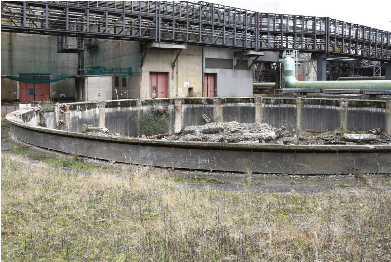
Kraftwerk Frimmersdorf II: Ventilator-Kühlturmtasse 29, Ansicht von Westen