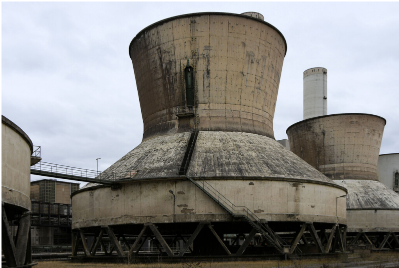
Kraftwerk Frimmersdorf II: Ventilator-Kühlturm 26, Ansicht von Nordwesten