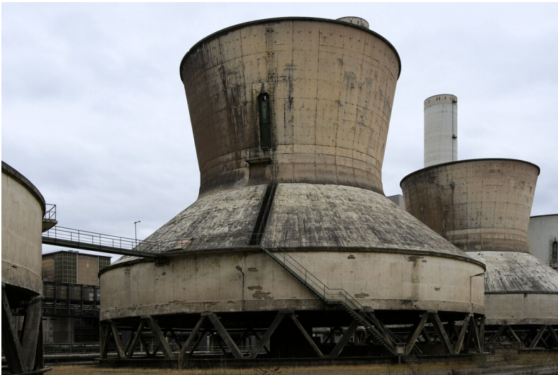
Kraftwerk Frimmersdorf II: Ventilator-Kühlturm 26, Ansicht von Nordwesten