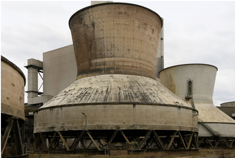
Kraftwerk Frimmersdorf II: Ventilator-Kühlturm 24, Ansicht von Nordwesten; Foto: 22.03.2023