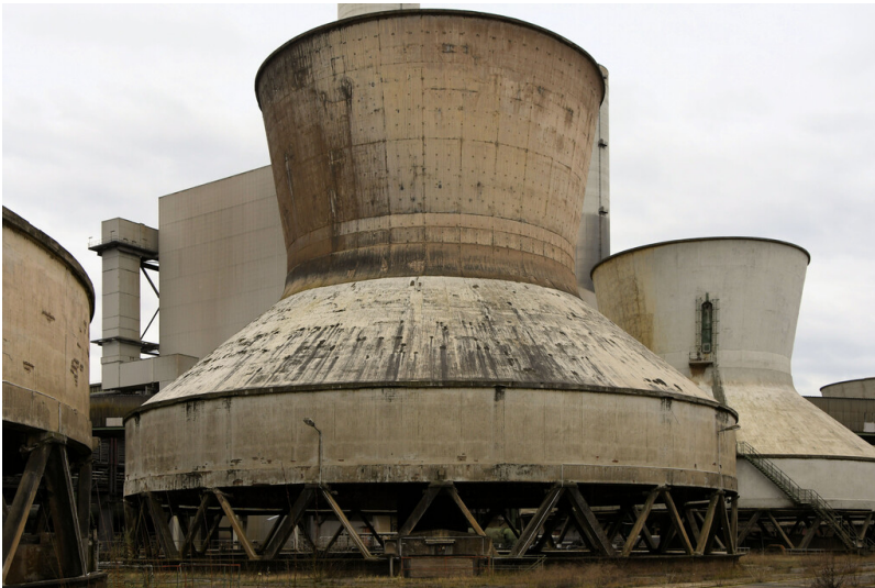
Kraftwerk Frimmersdorf II: Ventilator-Kühlturm 24, Ansicht von Nordwesten; Foto: 22.03.2023