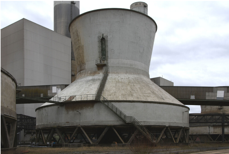
Kraftwerk Frimmersdorf II: Ventilator-Kühlturm 23, Ansicht von Nordwesten; Foto: 22.03.2023