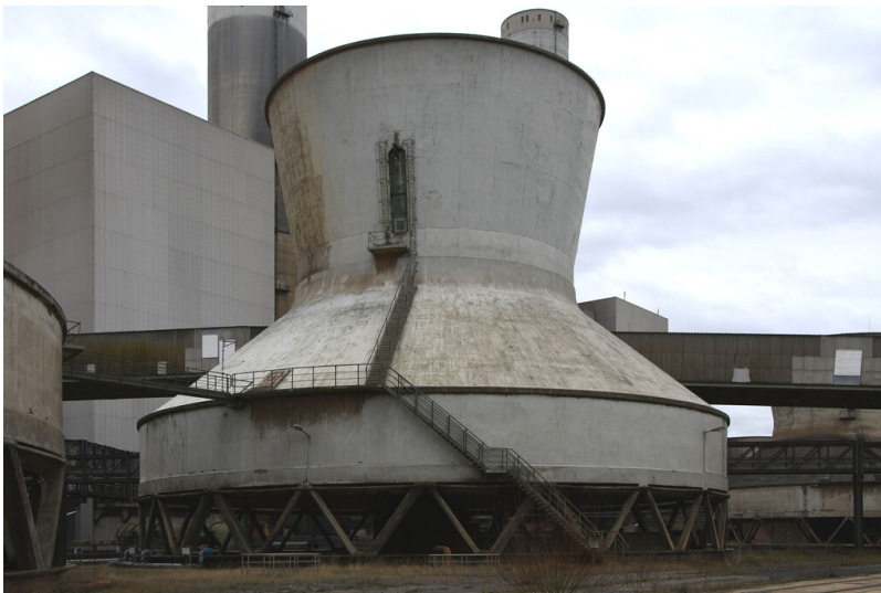
Kraftwerk Frimmersdorf II: Ventilator-Kühlturm 23, Ansicht von Nordwesten; Foto: 22.03.2023