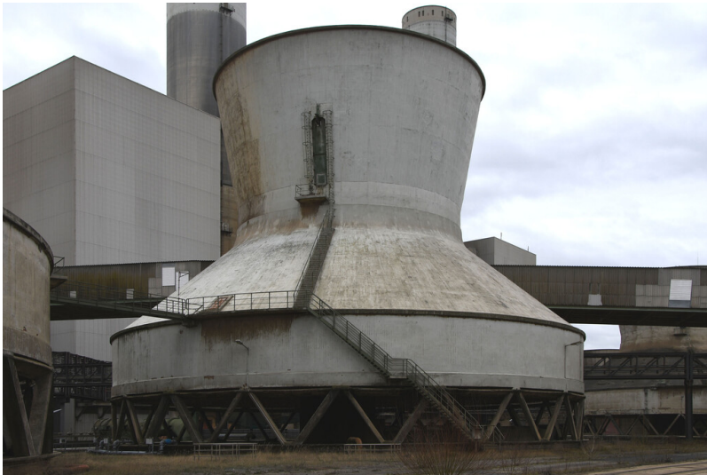
Kraftwerk Frimmersdorf II: Ventilator-Kühlturm 23, Ansicht von Nordwesten; Foto: 22.03.2023