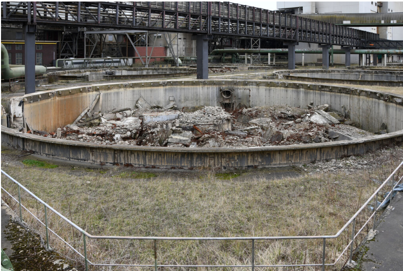
Kraftwerk Frimmersdorf II: Ventilator-Kühlturmtasse 20, Ansicht von Nordwesten; Foto: 22.03.2023