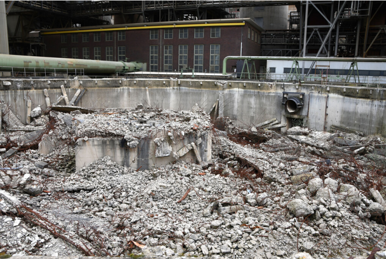
Kraftwerk Frimmersdorf II: Ventilator-Kühlturmtonne 19, Stahlbetonreste des ehemaligen Kühlturmbaus, Ansicht von Westen