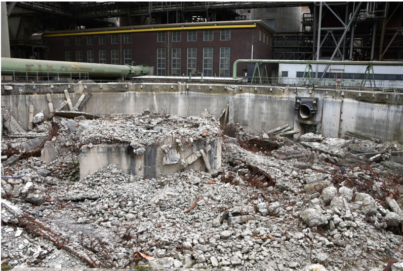
Kraftwerk Frimmersdorf II: Ventilator-Kühlturmtasse 19, Stahlbetonreste des ehemaligen Kühlturmbaus, Ansicht von Westen