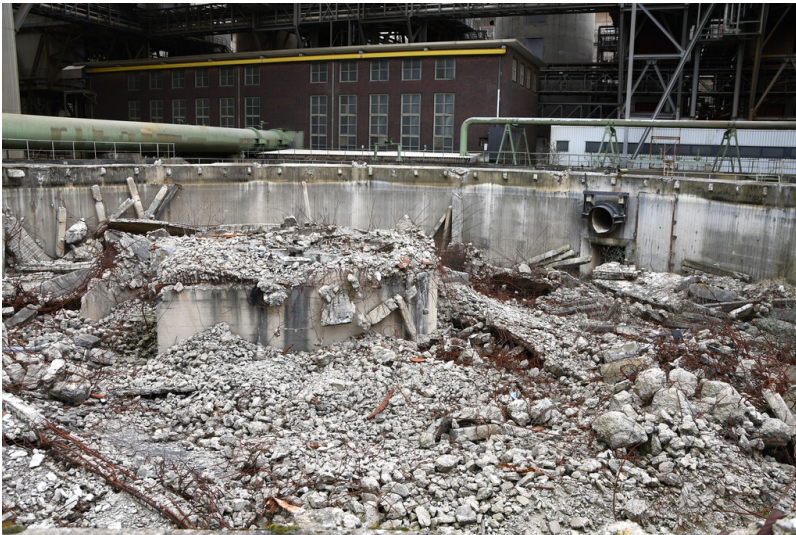
Kraftwerk Frimmersdorf II: Ventilator-Kühlturmtonne 19, Stahlbetonreste des ehemaligen Kühlturmbaus, Ansicht von Westen