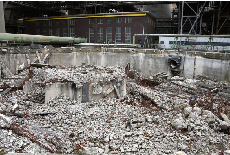
Kraftwerk Frimmersdorf II: Ventilator-Kühlturmtonne 19, Stahlbetonreste des ehemaligen Kühlturmbaus, Ansicht von Westen