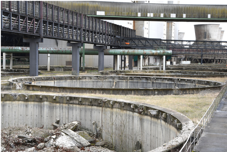
Kraftwerk Frimmersdorf II: Ventilator-Kühlturmtasse 18, Ansicht von Norden; Foto: 22.03.2023