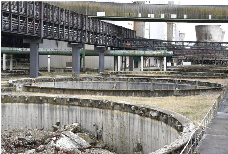
Kraftwerk Frimmersdorf II: Ventilator-Kühlturmtasse 18, Ansicht von Norden