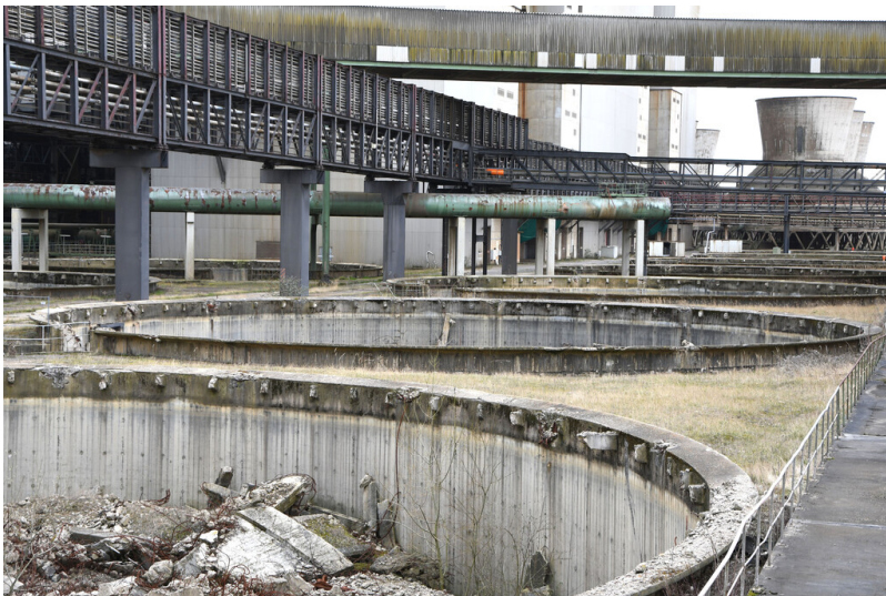
Kraftwerk Frimmersdorf II: Ventilator-Kühlturmtasse 18, Ansicht von Norden