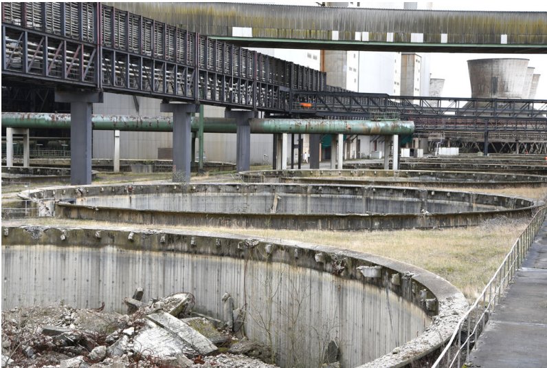
Kraftwerk Frimmersdorf II: Ventilator-Kühlturmtasse 18, Ansicht von Norden; Foto: 22.03.2023