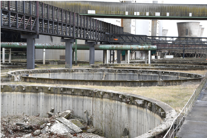
Kraftwerk Frimmersdorf II: Ventilator-Kühlturmtasse 18, Ansicht von Norden