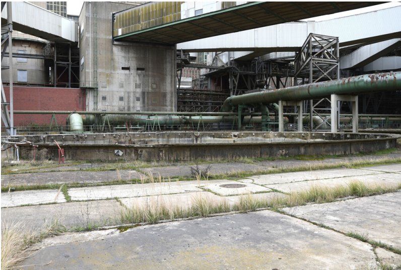
Kraftwerk Frimmersdorf II: Ventilator-Kühlturmtasse 17, Ansicht von Westen; Foto: 22.03.2023