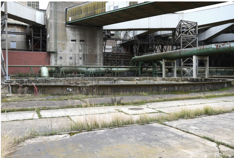
Kraftwerk Frimmersdorf II: Ventilator-Kühlturmtasse 17, Ansicht von Westen; Foto: 22.03.2023