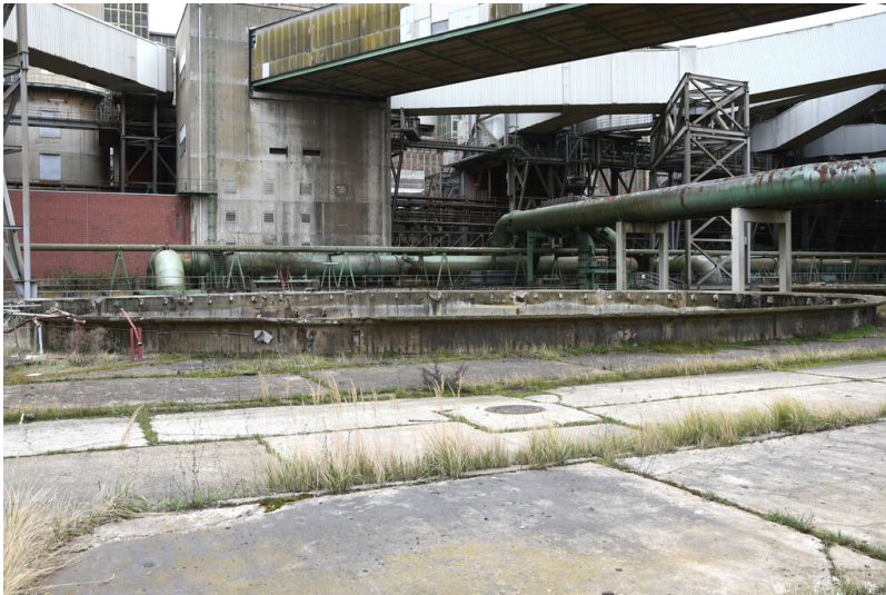
Kraftwerk Frimmersdorf II: Ventilator-Kühlturmtasse 17, Ansicht von Westen; Foto: 22.03.2023