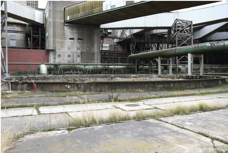
Kraftwerk Frimmersdorf II: Ventilator-Kühlturmtasse 17, Ansicht von Westen; Foto: 22.03.2023