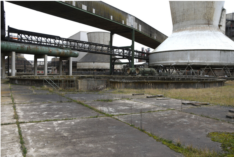
Kraftwerk Frimmersdorf II: Ventilator-Kühlturmtasse 16, Ansicht von Norden