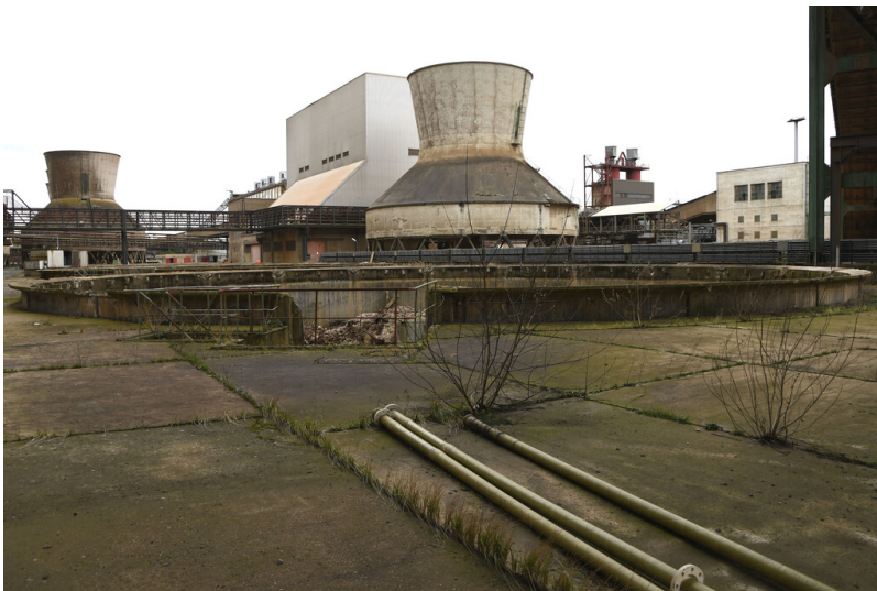
Kraftwerk Frimmersdorf II: Ventilator-Kühlturmtasse 14, Ansicht von Nordosten; Foto: 22.03.2023