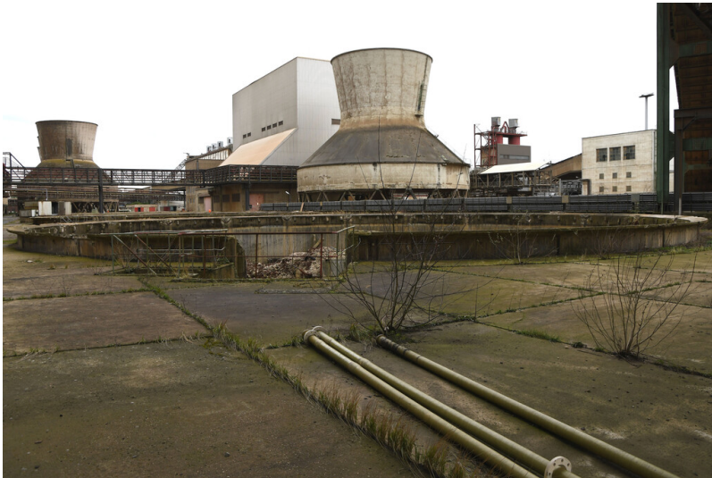
Kraftwerk Frimmersdorf II: Ventilator-Kühlturmtasse 14, Ansicht von Nordosten; Foto: 22.03.2023