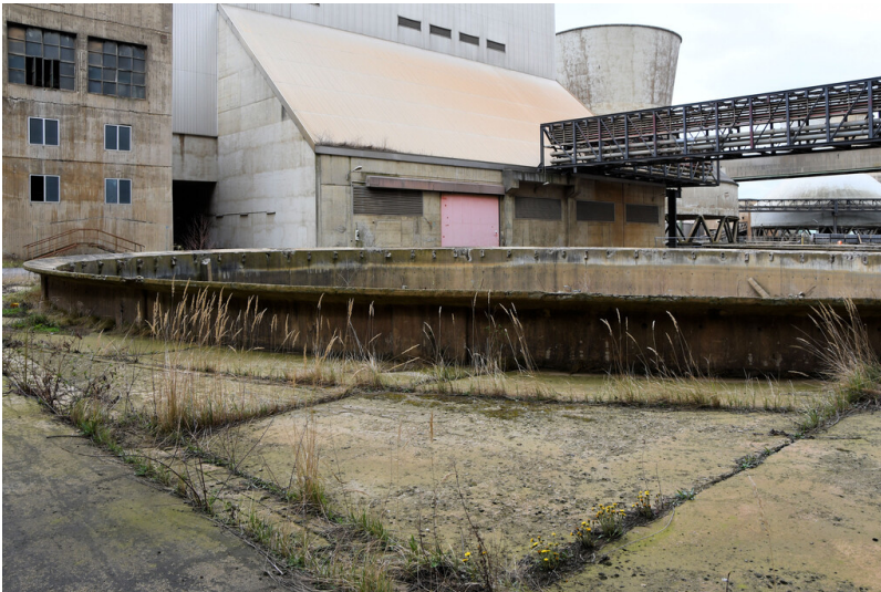
Kraftwerk Frimmersdorf II: Ventilator-Kühlturmtasse 8, Ansicht von Südosten; Foto: 22.03.2023