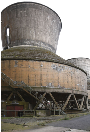
Kraftwerk Frimmersdorf II: Ventilator-Kühlturm 5, Ansicht von Nordwesten; Foto: 22.03.2023