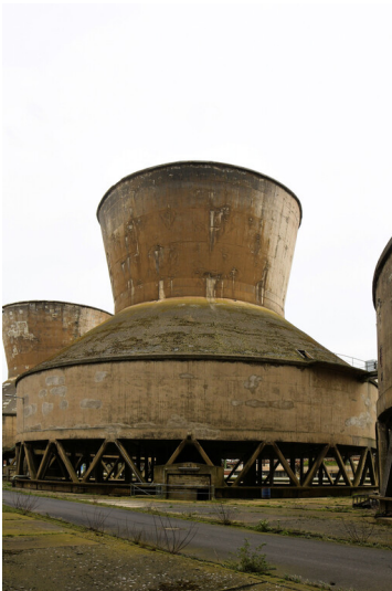
Kraftwerk Frimmersdorf II: Ventilator-Kühlturm 4, Ansicht von Nordosten; Foto: 22.03.2023