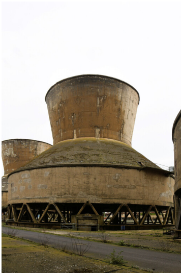
Kraftwerk Frimmersdorf II: Ventilator-Kühlturm 4, Ansicht von Nordosten; Foto: 22.03.2023