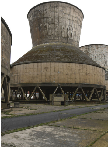
Kraftwerk Frimmersdorf II: Ventilator-Kühlturm 3, Ansicht von Nordwesten; Foto: 22.03.2023