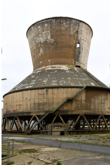
Kraftwerk Frimmersdorf II: Ventilator-Kühlturm 2, Ansicht von Nordosten