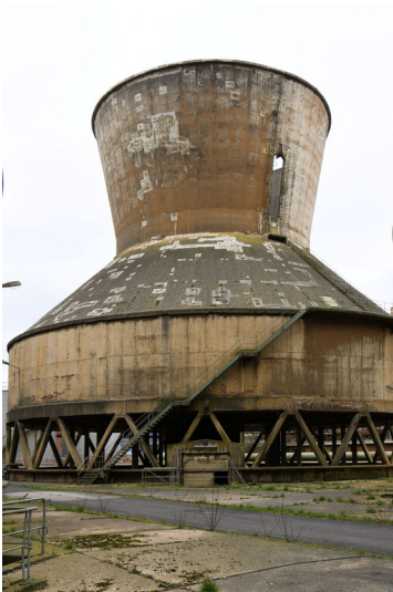
Kraftwerk Frimmersdorf II: Ventilator-Kühlturm 2, Ansicht von Nordosten; Foto: 22.03.2023