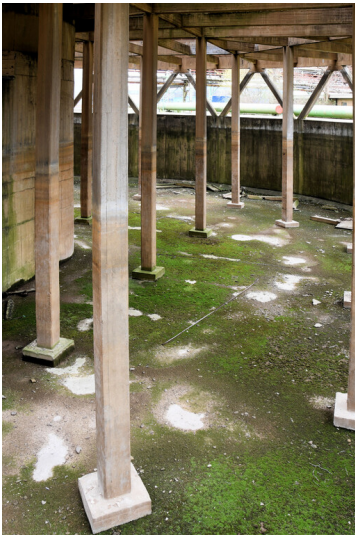
Kraftwerk Frimmersdorf II: Ventilator-Kühlturm 1, Kühlturmeinbauten; Foto: 22.03.2023