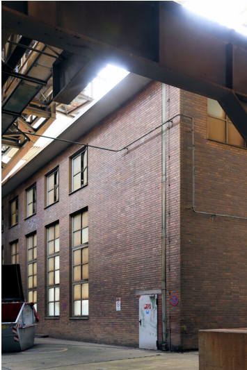
Kraftwerk Frimmersdorf II: Kühlwasser-Pumpenhaus 3, Ansicht von Nordosten; Foto: 21.03.2023