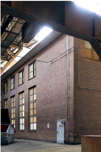
Kraftwerk Frimmersdorf II: Kühlwasser-Pumpenhaus 3, Ansicht von Nordosten; Foto: 21.03.2023