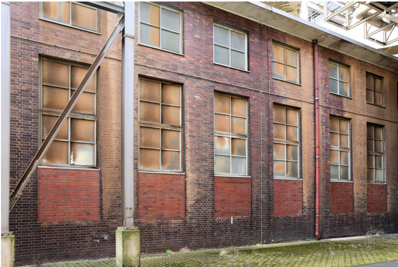
Kraftwerk Frimmersdorf II: Kühlwasser-Pumpenhaus 1, Ansicht von Südosten