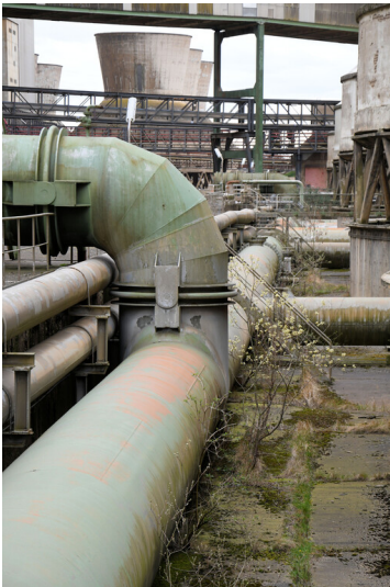
Kraftwerk Frimmersdorf II: Kühlwasserleitungen östlich von Kühlturm 26, Zuführungen in die Kühltürme, Ansicht von Norden; Foto: 22.03.2023