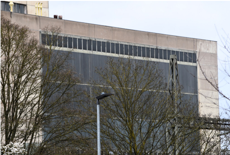
Kraftwerk Frimmersdorf II: Maschinenhaus Block Q, Ansicht von Osten; Foto: 22.03.2023