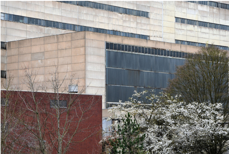
Kraftwerk Frimmersdorf II: Maschinenhaus Block P, Ansicht von Südosten; Foto: 22.03.2023