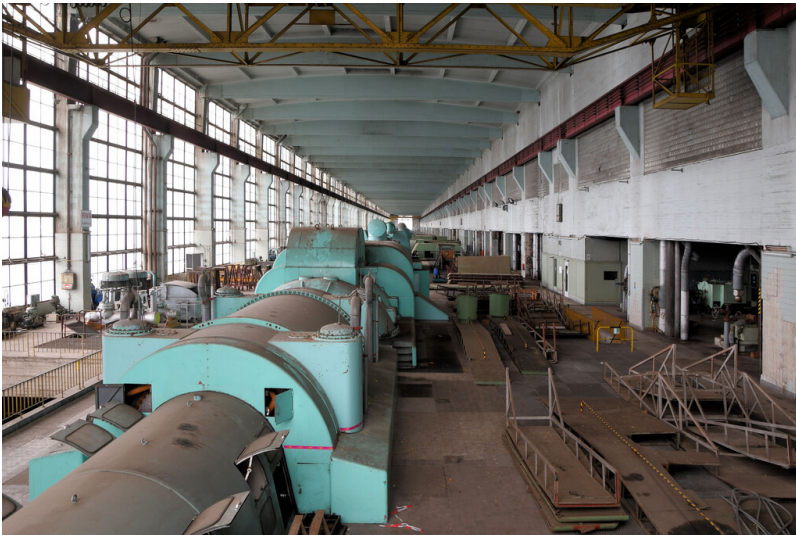
Kraftwerk Frimmersdorf II: Maschinenhaus, Innenansicht von Norden in Richtung Blöcke K/L/M; Foto: 21.03.2023