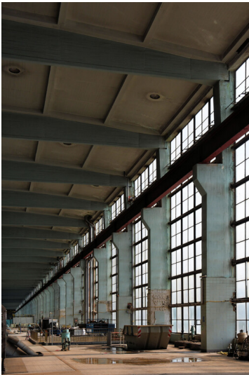
Kraftwerk Frimmersdorf II: Maschinenhaus Blöcke C/D, Konstruktionsdetails Ostseite; Foto: 23.06.2023