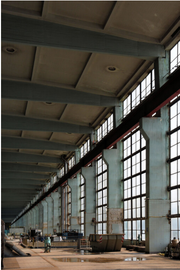
Kraftwerk Frimmersdorf II: Maschinenhaus Blöcke C/D, Konstruktionsdetails Ostseite