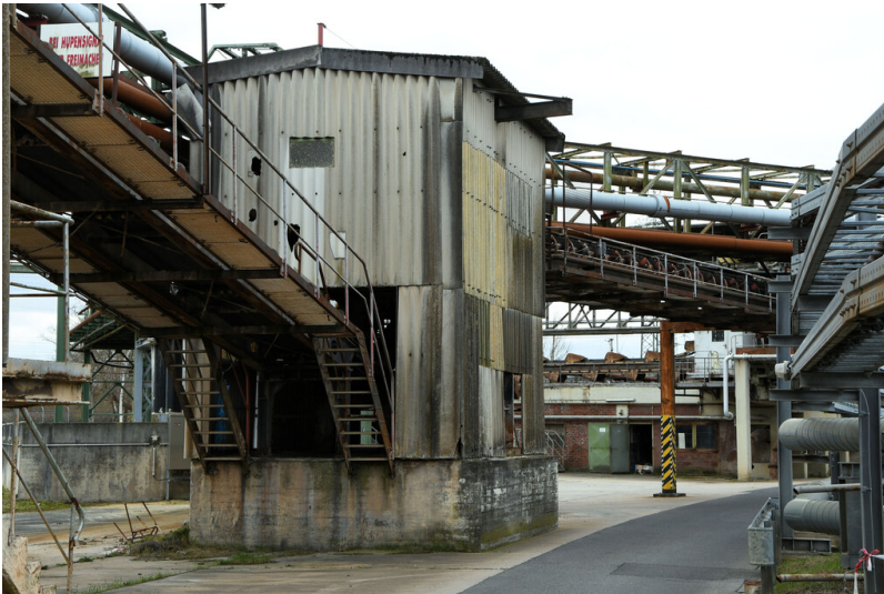
Kraftwerk Frimmersdorf II: Ascheturm 2, Eckturm für Ascheband von den Absetzbecken zum Aschefernbahn, Ansicht von Norden